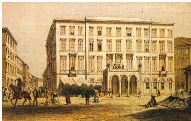
Az újjáépített Angol Királynő szálló Rudolf Alt 1851-es metszetén

Deák neve a passzív ellenállás és a kiegyezés fogalmával kapcsolódik össze szorosan. 1850-ben Schmerling igazságügyi miniszter felkérte, hogy vegyen részt egy magánjoggal foglalkozó tanácskozáson. Deák a megtorlásokra és az ostromállapotra való hivatkozással megtagadta a Béccsel való együttműködést. Ha ugyanis közreműködött volna ebben a