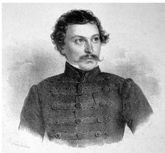
Deák Ferenc 1830 körül (Josef Kriehuber litográfiája)

Nevelését testvérei oldották meg, mint ahogy Antal nevű bátyjának köszönhette azt is, hogy Zala vármegye követe lett 1833-ban, és innen csupa olyan híres ember barátjának mondhatta magát, akik a politikai vagy kulturális életben maradandót alkottak; és alighanem ők is büszkék voltak arra, hogy az ország befolyásos emberének lehettek barátai. Egyrészt pesti joggyakorlata idején, másrészt pedig később, 1824-25-ben kapcsolatba került a Kisfaludy Károly körül csoportosuló ifjabból álló Aurora Körrel . Deák Pesten ismerkedett meg Stettner Györggyel,