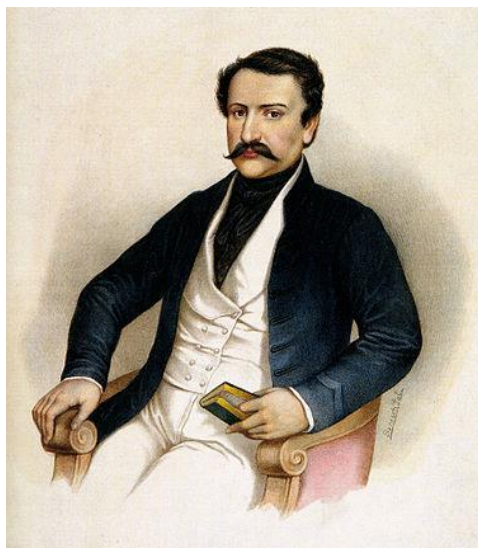
Deák 1840 körül (Benesch Pál festménye)

törvénytelen ségek teljes körű kivizsgálása után foglalkozzon az országgyűlés az adó- és az újoncmegajánlással. Az udvar engedett, szabadon bocsátották a bebörtönzötteket, és törölték a be nem fejezett politikai pereket. Ez az országgyűlés Deák országgyűlése volt. Amikor befejeződött az országgyűlés, Deák ezer aláírással ellátott emlékkönyvet kapott. Ekkor vált