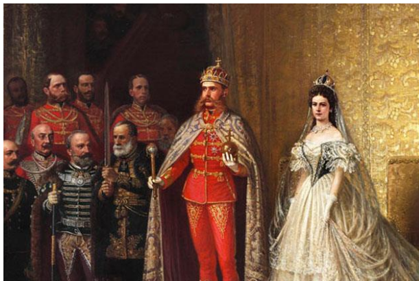
Eduard von Engerth: I. Ferenc József királlyá koronázása Budán, 1867-ben (részlet)

Az uralkodó a tárgyalások során különleges jogokat kapott. Az udvar tanult a '48-as eseményekből: a hadsereg vezetése az uralkodó kizárólagos joga lett. Személyi kérdésekben egyedül dönthetett, például a magyar miniszterelnök kinevezése ügyében is. Deák tudta nélkül került be az uralkodói jogkörbe az előszentesítés joga, amit Deák annyira sérelmesnek tartott, hogy nem ment el a június 8-ai királykoronázásra. A