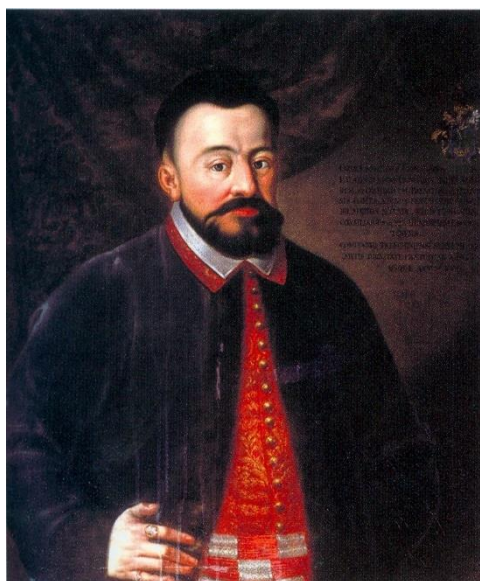
J. Ziegler: Illésházy István

Ezek a lépések nagyon hasonlítanak II. Mátyás (1608–1619) koronázására. II. Mátyás avatási ceremóniáját azonban megelőzte az országgyűlés, ahol a rendek először megválasztották a főherceget magyar királynak. Ez viszont nem volt feltétel nélküli, ugyanis számtalan közjogi kérdésben kellett egyezsége jutni. 1608. október 23-án nyílt meg Pozsonyban a diéta, amelyen Mátyás számos törvényt fogadott el. Ezek közül az egyik legfontosabb a bécsi béke ratifikálása volt, de mellette kimondták, hogy a király csak a rendek hozzájárulásával indíthat háborút, a legfontosabb tisztségeket csak magyarok viselhetik, és a Szent Koronát Magyarországon, a pozsonyi vár koronatornyában kell őrizni. Mindez a rendi