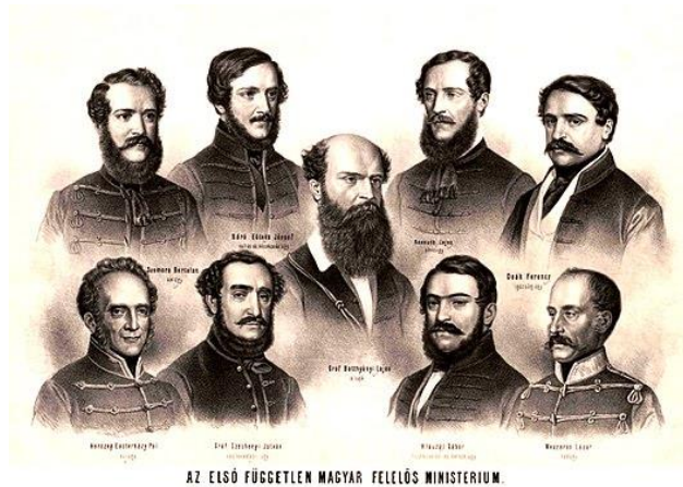
Barabás Miklós: Az első felelős kormány. Deák Ferenc, az igazságügyi miniszter jobbról nézve fent az első.

Bécshez fűződő viszonya inkább Széchenyihez állt közel: azt vallotta, hogy a magyaroknak szükségük van a Habsburg Birodalom támogatására a nemzetiségi mozgalmakkal és az orosz fenyegetettséggel szemben. A bécsi és a pesti forradalom katalizátorként hatott az utolsó rendi országgyűlésre. Az utolsó